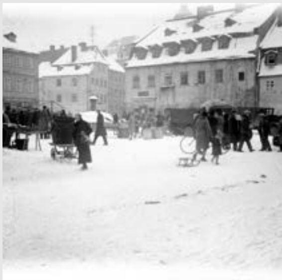
Týdenní trh na starém náměstí 14. února 1931