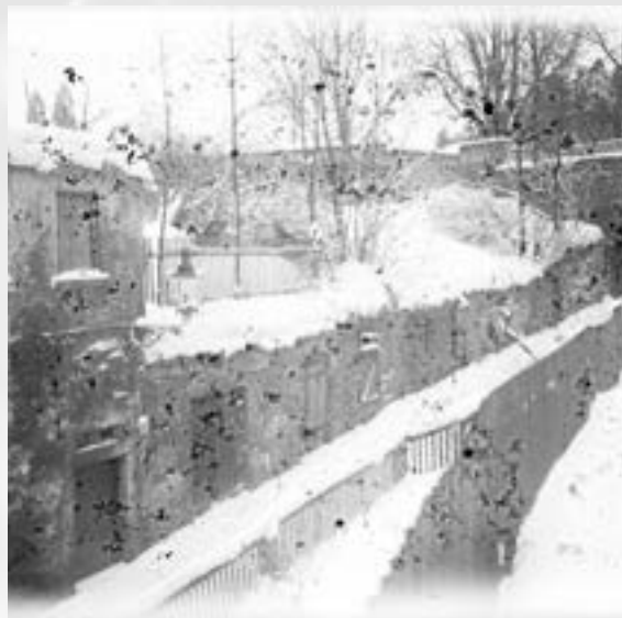
Ulice na Příkopech (Graben Gasse), dnes ulice U Radnice

Velkým požárem bylo zničeno 167 domů, 78 stodol a 250 rodin zůstalo bez přístřeší.