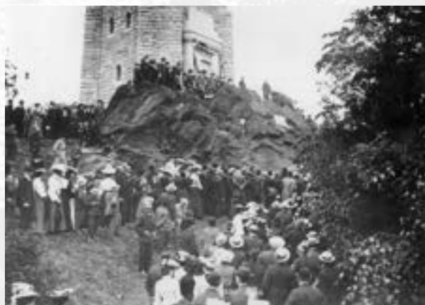
Slavnostní otevření rozhledny na vrchu Háji, 19. červen 1904

I po vysídlení/odsunu německého obyvatelstva po roce 1945 zůstala rozhledna a vrch Háji navštěvovaným místem. V 50. a 60. letech 20. století navštěvovalo rozhlednu v průměru 10 000 lidí ročně. Využívala se také restaurace přímo pod rozhlednou a 27. ledna 1968 byl na Háji uveden do provozu lyžařský vlek. Vrch Háji se tak stal lyžařským střediskem.