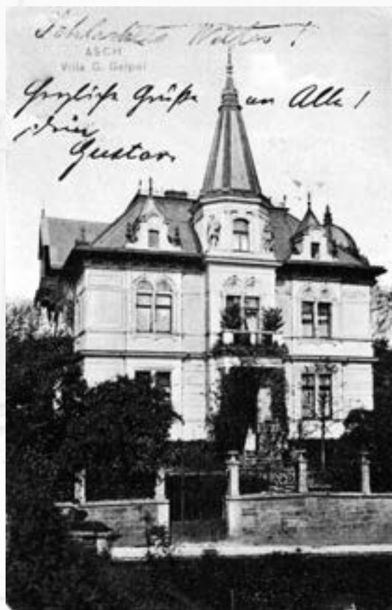
Pohlednice vily G. Geipela s jeho podpisem

Ještě po své smrti zanechal svému milovanému domovu odkaz – velké pozemky s přáním, aby se ponechaly jako stavební parcely, v závěti ze 4. dubna 1914 zanechal 200.000 na stavbu plicního sanatoria, 200.000 korun na postavení tří domů v Hranicích u Aše, Libé a Skalné pro nemocné tkalce a městu Aši odkázal 6 miliónů korun – z částky mělo být kryto dláždění zbývajících ulic a dluhy města.