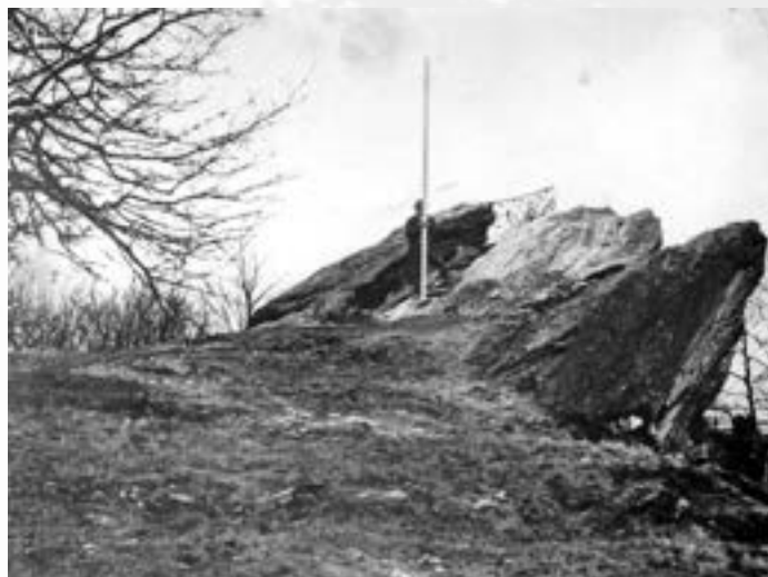
Vrchol Háje před postavením rozhledny, muž se zeměměřičskou tyčí

Slavnostní otevření se kvůli nepřízni ročního období přesunulo až na následující rok.