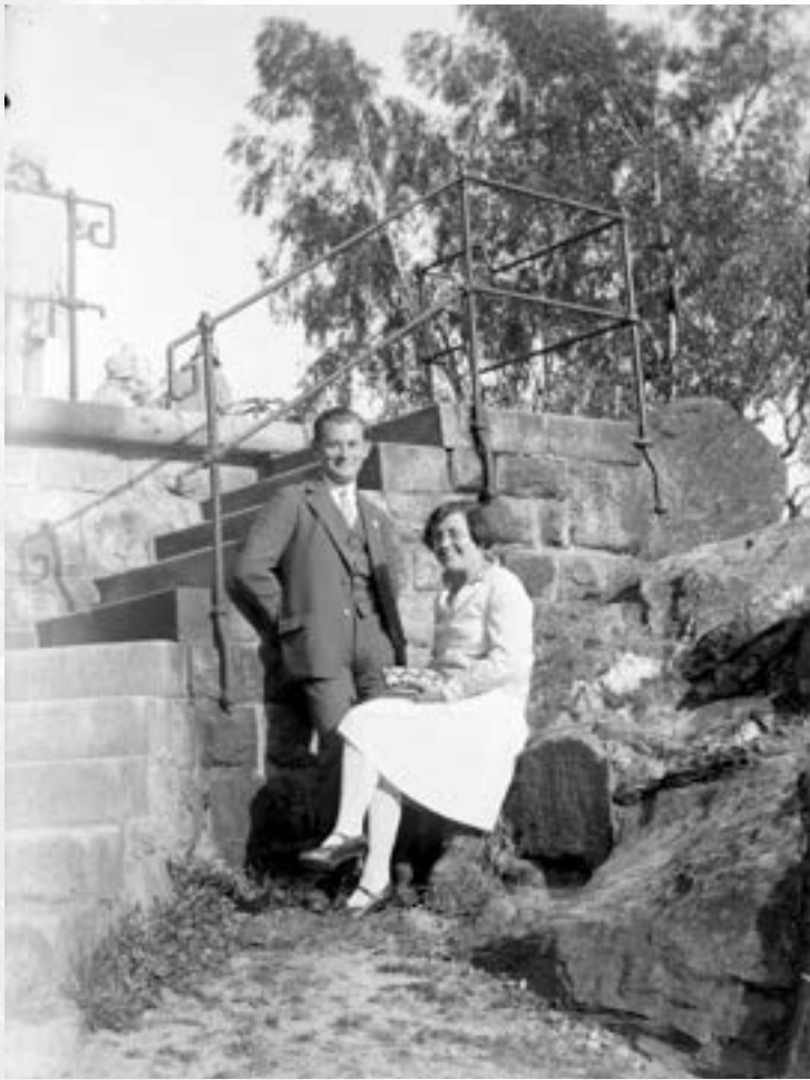
Mladý pár u schodů na rozhlednu