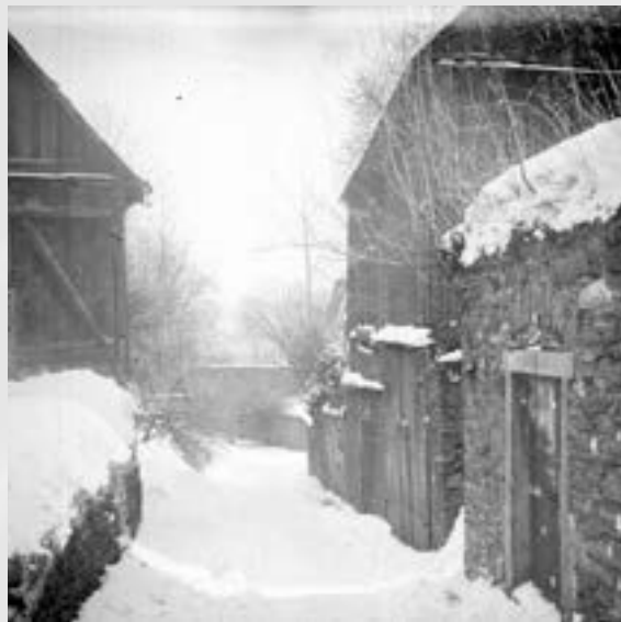
Pohled ke kamennému mostu

Dva zloději chtěli v noci ukrást prase v Krásné, a protože zde byli při činu vyrušeni, odešli do Aše do domu, kde požár vznikl. Poučení z nepodařeného pokusu v Krásné chtěli prase v tichosti omámit sirným dýmem a ukrást. Od jisker ale chytlá sláma, a to byl počátek vzniku celého požáru. K tomu se prý přiznal jeden z mužů až na smrtelné posteli.