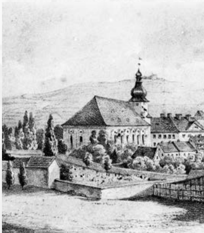
Evangelický kostel se hřbitovem podle obrazu z r. 1854

Původní hřbitov byl v Aši nejstarší. Sloužil nejen pro Aš samotnou, ale také pro všechny okolní obce: Horní a Dolní Paseky, Verněřov, Mokřiny, Nový Ždár, Nebesa, Krásná, Štítary, Újezd, Podhradí, Sorg, Elfhausen, Studánka, Kopaniny, Neuhausen, Schönwind, Lauterbach, Wildenau, Mühlbach a Reichenbach.