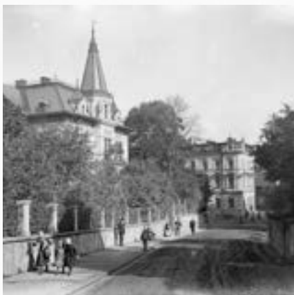
Pohled do dolní části ulice Gustava Geipela

LETOS SI PŘIPOMÍNÁME 110 LET OD JEHO ÚMRTÍ