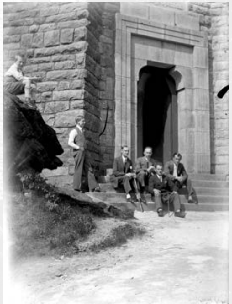
Skupina výletníků před vchodem na rozhlednu