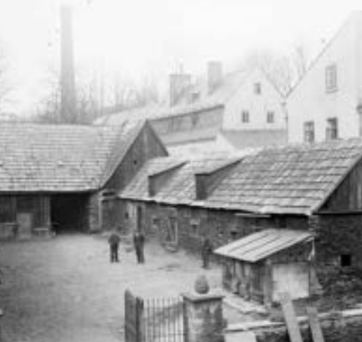
Dvůr statku ve Slovanské ulici, svého času zde sídlily Sběrné suroviny

Vzpomeňme si proto na klíčové osobnosti a události, jež ovlivnily průběh dějin a připomeňme si, že i my sami máme důvod být hrdí na svůj původ.