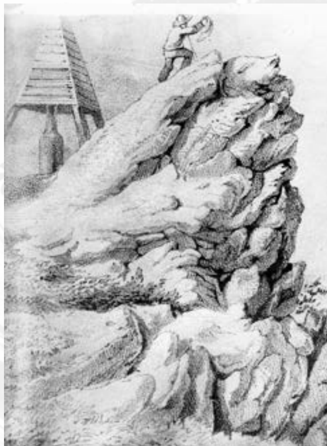
Vrchol Háje s triangulačním bodem z r. 1854., podle kresby Traugotta Albertiho

Očekávaná cena projektu na stavbu dělala 6000–8000 zlatých.