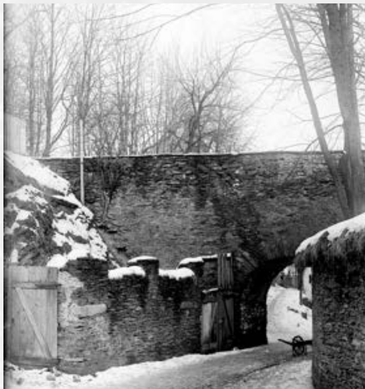
Most na Příkopech, zimní pohled

Od roku 1987 je kulturní památkou a letos slaví již 300 let.