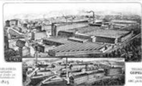
Reklama firmy cílená na anglický trh