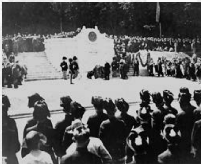
Slavnostní odhalení pomníku 14. července 1924

21. února 1923 rozhodlo ašské zastupitelstvo o zřízení pomníku Gustava Geipela na Kuželce k jeho trvalé vzpomínce. Pomník byl odhalen 14. července 1924 . A tak si můžeme stále připomínat tohoto šlechtetného čestného občana města Aše, dokud pomník bude stát.