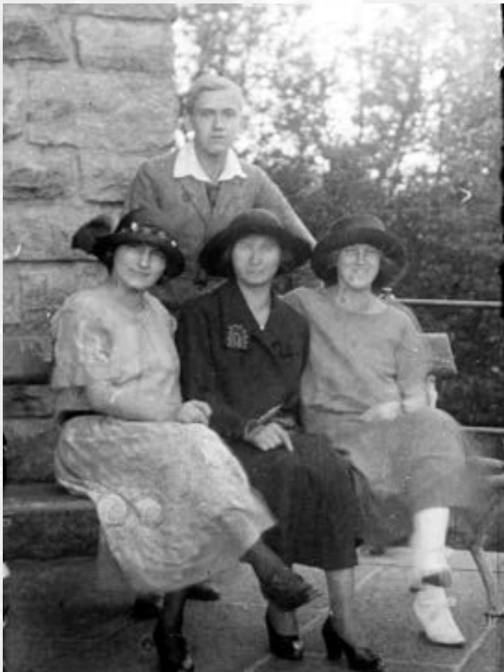
Skupina výletníků na terase rozhledny