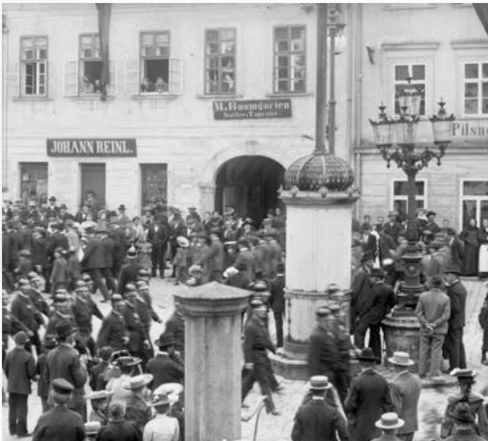
Staré náměstí – pohled od kašny k západní straně náměstí při oslavě na počest dokončení stavby rozhledny na vrchu Háj 19. června 1906