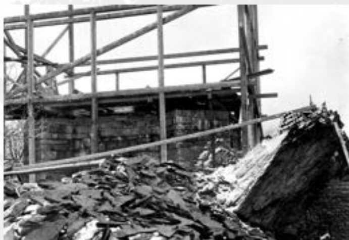
Stavba rozhledny na vrchu Háj – základy s lešením, r. 1902–1903