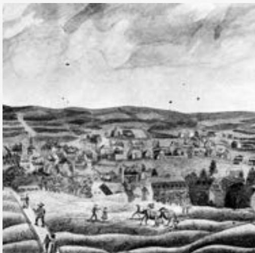
Pohled na Aš podle staré perokresby z r. 1837