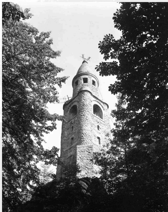
Rozhledna na vrchu Háji v 60. letech 20. století