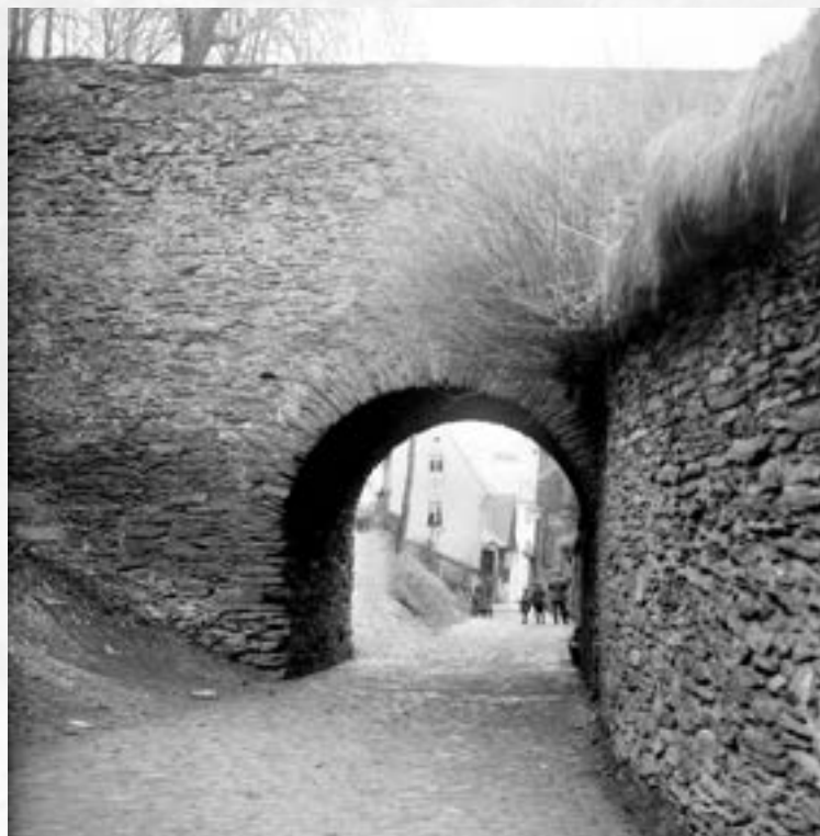
Průhled mostem na Příkopech, r. 1929