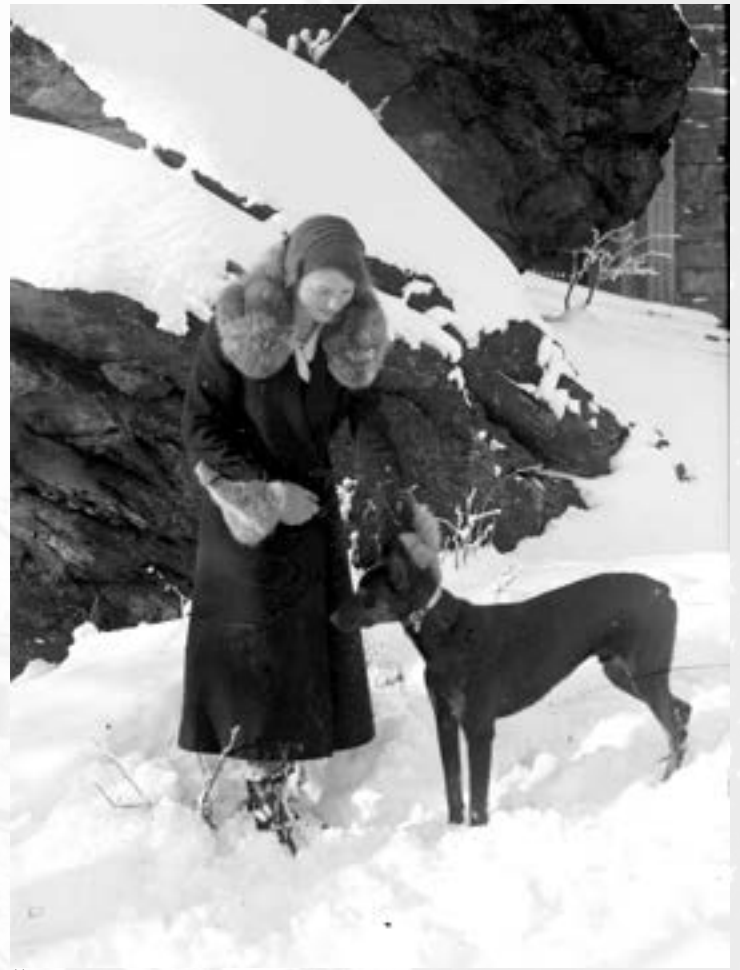
Žena se psem u rozhledny