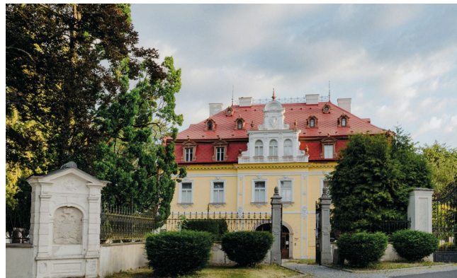
/Současná podoba domu čp. 3 – Textilní muzeum Aš/

Po požáru v roce 1814 si Zedtwitzové postupně vystavěli v Aši další sídla, ale ani jedno z nich se do dnešních dnů nedochovalo (Kaltenhof – přibližně dnešní sídliště Nemocniční/ Dlouhá, Stein – oblast dnešní Kamenné a Pivovarské ulice, sídlo v oblasti ulic Kamenná a Mikulášská).