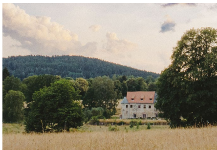
/Současná podoba zámku Kopaniny/

Kopaniny jsou prvně písemně doložené v listině z roku 1315, první písemná zmínka o kopaninském panském sídle pochází ale až z roku 1537, kdy byly sídlem jedné z rodových větví pánů z Zedtwitz. V průběhu staletí Zedtwitzové hrad, později přestavěný na zámek (Bartoloměj z Zedtwitz v roce 1610) několikrát stavebně upravili a rozšířili (1677-1678, 1767, klasicistní úprava v 19. století). Zedtwitzové drželi zámek až do 1. poloviny 20. století, kdy museli areál z finančních důvodů prodat.