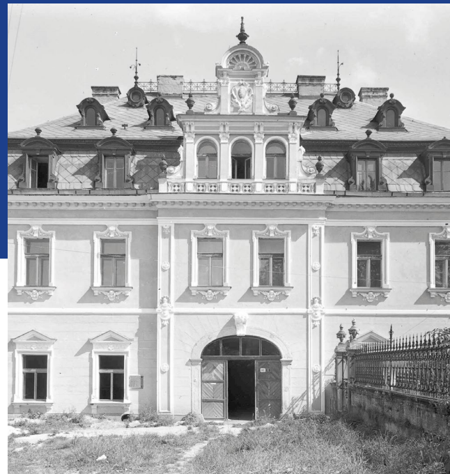
/Dům čp. 3 v Mikulášské ulici, 1892/

Na důkaz císařské ochrany směl majitel panství umístit na bránu kámen s přípisem Salva Guardia a reliéfem císařského znaku. Ten mimo jiné osvobozoval od povinného ubytování císařského vojska.