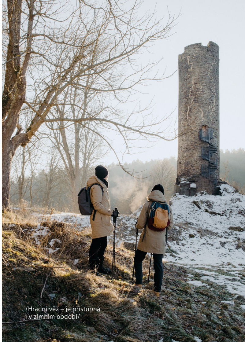
/Hradní věž – je přístupná i v zimním období/

Do dnešních dnů se nám ale dochovala jen stará hradní věž. Budovy jednotlivých zámků vzali za své v průběhu 20. století. V současné době patří areál obci Podhradí, která celý prostor postupně obnovuje.