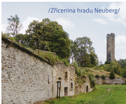
/Zřícenina hradu Neuberg/

Vchod do skoro 22 m vysoké věže se nachází ve výšce 8 m a byl dostupný jen pomocí žebříku nebo lávky. Věž tak sloužila jako poslední útočiště při obléhání nepřítelem. Hrad vyhořel roku 1647. Jeho ruiny posloužily roku 1752 k vystavění tzv. „Horního zámku“. Ten padl za obět plamenům roku 1902. K jeho obnově již nedošlo.