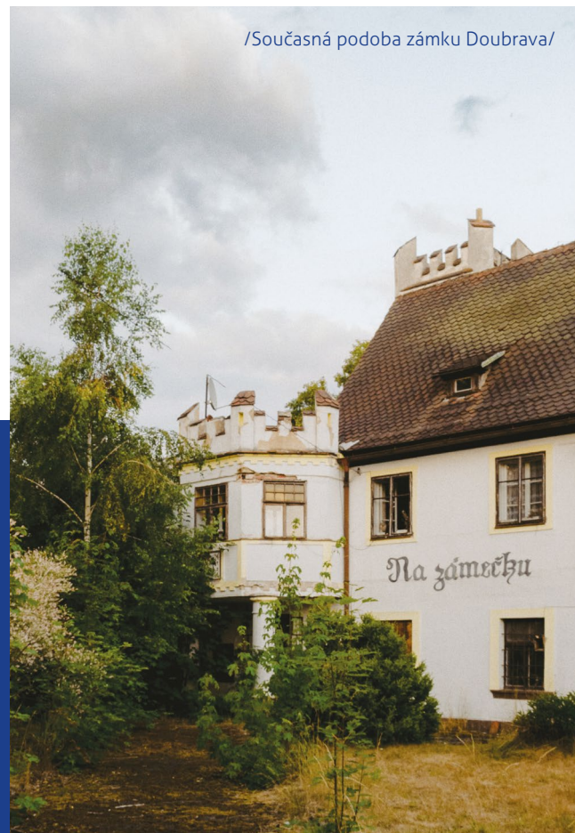
/Současná podoba zámku Doubrava/

Zámek postupně procházel různými stavebními úpravami. Současnou podobu v historizujícím slohu získal zámek v 19. století. Zámek, jedno z posledních dochovaných sídel pánů z Zedtwitz na Ašsku, je v současné době v majetku soukromého majitele (a chátrá – stav 2023).