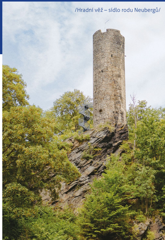
/Hradní věž – sídlo rodu Neubergů/